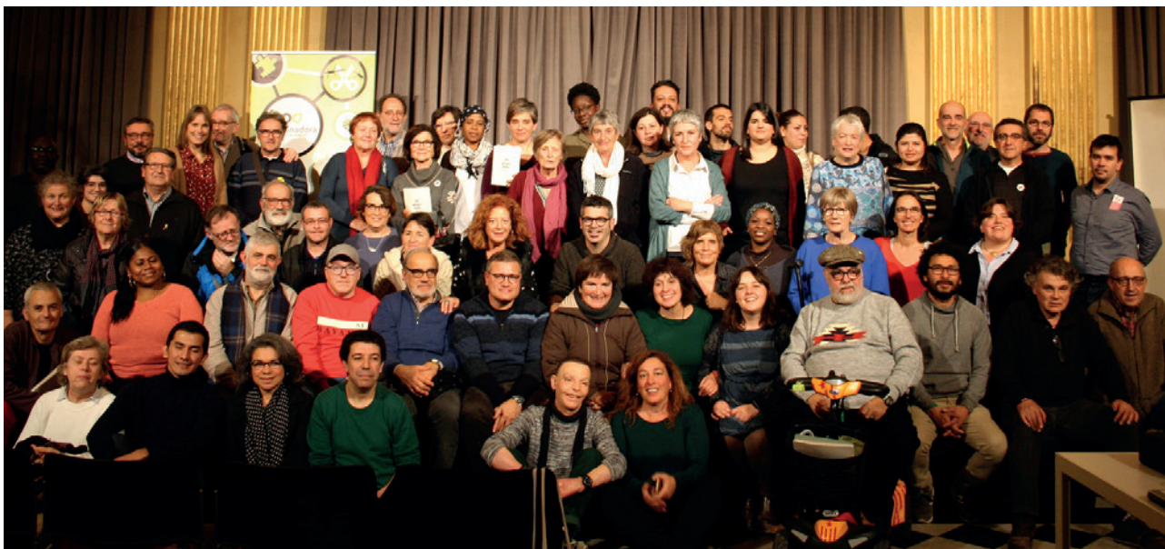
Membres i representants de les més de 50 entitats que formen la Coordinadora d'ONG de les comarques gironines i l'Alt Maresme.

El document que teniu entre mans recull el Pla Estratègic 2021-2024 de la Coordinadora d'ONG Solidàries de les comarques gironines i l'Alt Maresme. Aquest pla forma part del punt d'inflexió que va suposar el 25è aniversari de la Coordinadora, moment en què vam dur a terme una avaluació externa fruit de la qual va sorgir la necessitat i la utilitat d'elaborar un Pla Estratègic. En aquest procés hem estat molt ben guiats i acompanyats per l'equip de la cooperativa Resilience Earth.